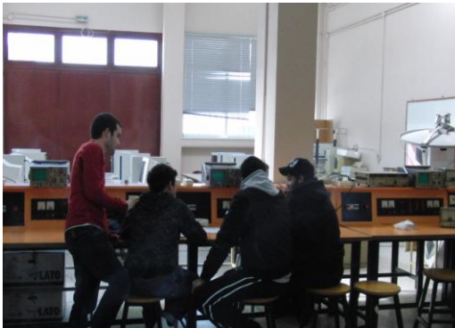
Το Εργαστήριο 5