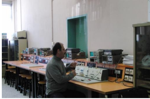
Το Εργαστήριο 4