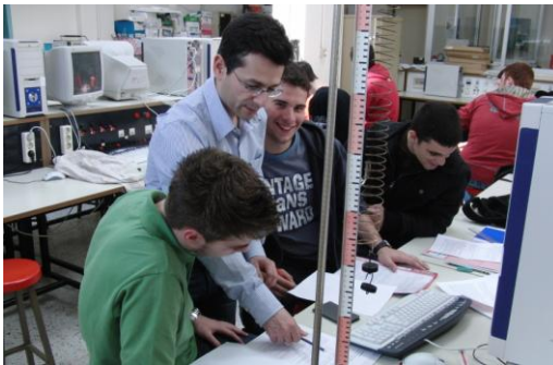
Το Εργαστήριο 3