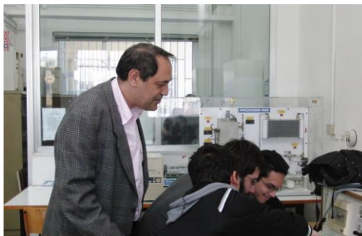
Το Εργαστήριο 10